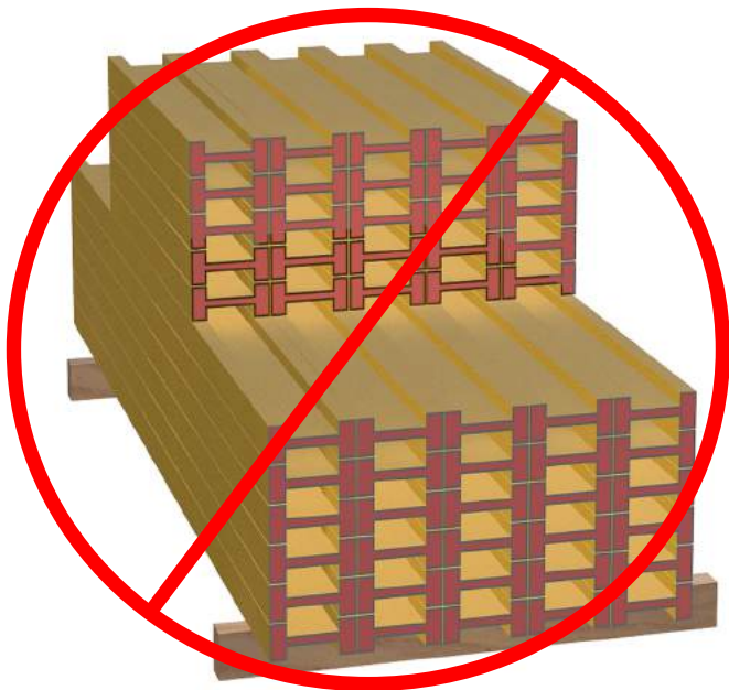
Netaisyklingai sukrautos sijos

Klojinių pakrovimas ir iškrovimas vykdomas autokrautuvais. Įrangą grąžinus tam netinkamu transportu (autobusiukais, neatsidarančiais bortais automobiliais ar pan.) NUOMININKAS privalo atsivežti savo darbininkus, kurie iškrautų įrangą sandėlyje. Jeigu netinkamą transportą iškrauna UAB "Transrifus" darbuotojai - imamas papildomas krovimo mokestis.